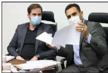
جانشین فرمانده انتظامی استان گیلان: