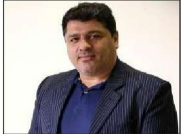
سوال جواب: مسابقات فوتسال جام شهید لندی در لاهیجان برگزار شد. به گزارش پایگاه خبری ورزش و جوانان گیلان: رقابتهای فوتسال جام شهید لندی در رده سنی زیر سیزده سال با حضور ۹ تیم در سالن ورزشی طبقاتی تختی لاهیجان برگزار شد که در پایان تیمهای فجر لاهیج، آرنا و ملوانان جوان بترتیب اول تا سوم شدند و به تیمهای برتر جایزه نقدی و لوح تقدیر اهدا شد.