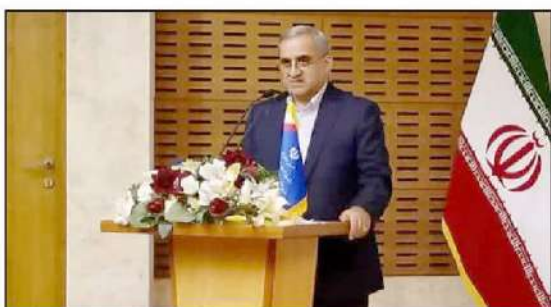
سوال جواب- سبکبه حسابی: بیش از ۲ هزار و ۷۱ میلیارد تومان تسهیلات به واحدهای تولیدی گیلان پرداخت شده است.

است که صنعتگران متحمل می‌شوند، اظهار داشت: باید این مشکلات برای پیشبرد امور رفع شود. دلق پویش با تأکید بر ضرورت حمایت از صنایع و تأمین نقدینگی آنها، گفت: سود بالای تسهیلات در صنعت توجیه ندارد و باید این قانون در مجلس بازنگری شود.