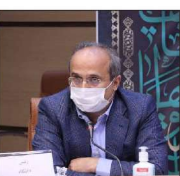
سوال جواب: رئیس دانشگاه علوم پزشکی گیلان در نشست توجیهی اجرای قانون حمایت از خانواده

تخت بستری بیمارستانی در استان، افزایش سرانه خوابگاهی از ۱۲ متر مربع به ۱۲/۵ متر مربع با خرید، تجهیز و بهره برداری از دو خوابگاه دانشجویی، جذب ۱۱۴ هیئت علمی در طی سه فراخوان اخیر و تأمین بالغ بر ۱۰۰۰ قلم تجهیزات پزشکی بیمارستانهای دولتی استان با ارزش ریالی بیش از ۹۰۰ میلیارد تومان از دیگر اقدامات دانشگاه عنوان کرد.