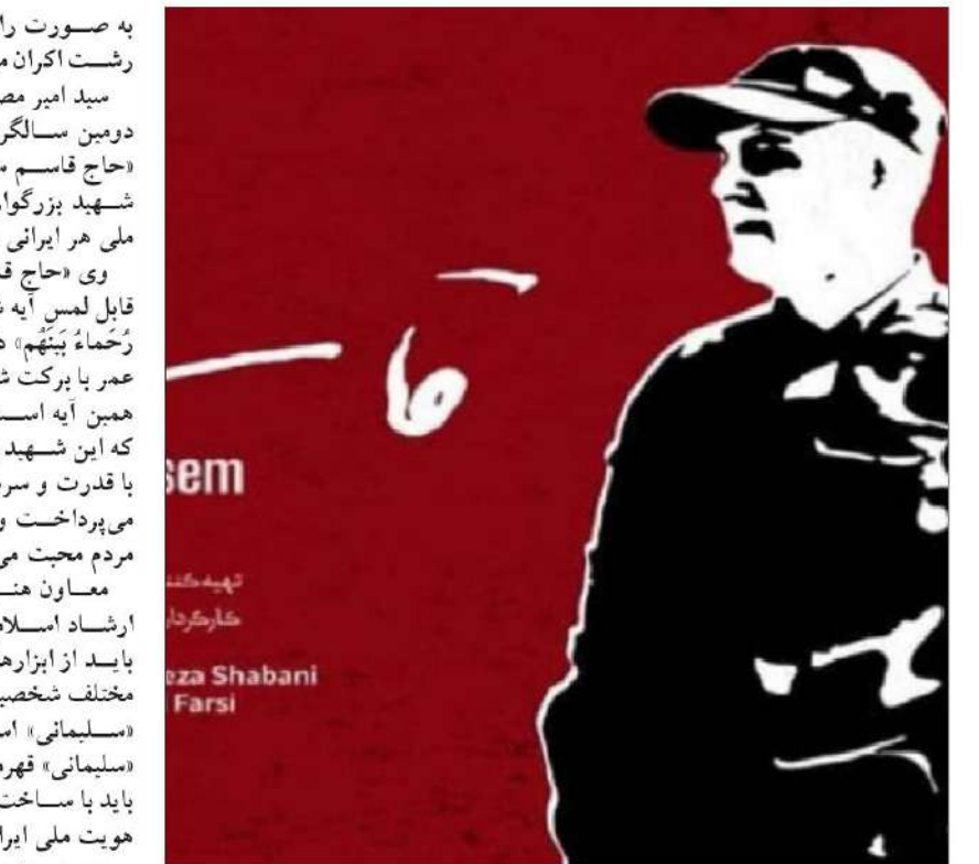
مهر: معاون هنری و سینمایی فرهنگ و ارشاد اسلامی گیلان گفت: مستند «قاسم» به مناسبت دومین سالگرد شهادت سردار «سلیمانی» روز سه شنبه

وی با اشاره به برنامه‌های پیش‌بینی شده برای گرامیداشت دومین سالگرد شهادت سردار شهید «حاج قاسم سلیمانی»، افزود: مستند «قاسم» در سینما ۲۲ بهمن رشت برای عموم مردم به نمایش گذاشته می‌شود. معاون هنری و سینمایی فرهنگ و ارشاد اسلامی گیلان با بیان اینکه اکران این مستند رایگان و ورود برای عموم آزاد است، اضافه کرد: مستند «قاسم» ساعت ۱۱ صبح سه شنبه در این سینما اکران می‌شود. وی با اشاره به اینکه مستند «قاسم» محصول مرکز مستند حقیقت است، گفت: این مستند به تهیه‌کنندگی «مرتضی شعبانی»، کارگردانی «مهدی فارسی» و نویسندگی «محمدرضا ابوالحسنی» تولید شده است.