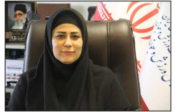
سوال جواب: مدیرکل ورزش و جوانان کیلان اظهار داشت: همزمان با سفر ریاست محترم جمهور و هیات همراه ۱۳۶ میلیارد تومان برای بازسازی و تکمیل ۱۰ پروژه نیمه تمام استان کیلان اختصاص یافت.

همچنین اعتبارات تخصصی برای برخی از پروژه‌های عمرانی در دو مرحله به سالهای ۱۴۰۱ و ۱۴۰۲ قابلیت اجرایی خواهد داشت. در این سفر مبلغ ۱۰ میلیارد تومان نیز بمنظور تعمیر و نگهداری اماکن ورزشی استان کیلان در نظر گرفته شد.