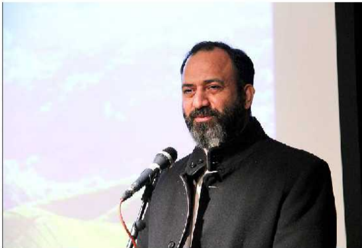
شکل‌گیری رسانه‌های متعدد در استان شده و هنر از سوی استانداری در نظر گرفته شده که به مرور پرداخت می‌شود.

نقش با اشاره به انتقادات اصحاب رسانه پیرامون پرداخت یارانه و بحث آگهی روزنامه‌ها، گفت: نیازمند یک پالایش قانونمندان در خصوص پرداخت یارانه به روزنامه‌ها هستیم لذا با ما فرصت دهید تا بتوانیم این مسیر را به درستی طی کنیم. موفقیت روابط عمومی‌ها منوط به بهره‌گیری از ظرفیت خبرنگاران است