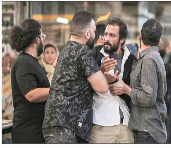
سیاوش طهمورث مطرح کرد:

ایستنا: در فهرست ۵۰ فیلم برتر سال ۲۰۲۱ به انتخاب ۱۸۷ منتقد بین المللی ساخته جدید اصغر فرهادی در رتبه ۲۳ جای گرفته است. نشریه سینمایی ایندی وایر با برگزاری یک نظرسنجی از ۱۸۷ منتقد سینمایی بین المللی اقدام به معرفی ۵۰ فیلم برتر سال ۲۰۲۱ کرده است و در این فهرست فیلم «قدرت سگ» ساخته «جین کمپبون» که پیشنماز جوایز اسکار نیز هست در رتبه نخست قرار گرفته و فیلم ژاپنی «ماشین منو بران» از «ریوسوکی هاماگوچی» و «پینزا لیکوریس» به کارگردانی «پل توماس اندرسون» نیز به ترتیب رتبه دوم و سوم را به خود اختصاص داده اند.