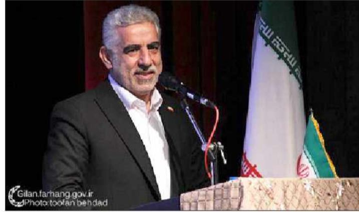
داشته‌هایمان را ارج بگذاریم به ظرفیت مردم تالار مرکزی رشت که بدون استفاده از هیچ حمایت سادی و معنوی دریغ نخواهیم کرد.

سوال جواب: استاندار گیلان بیان کرد: برای انتقال و تقویت فرهنگ و هنر بومی از هیچ حمایت سادی و معنوی دریغ نخواهیم کرد.