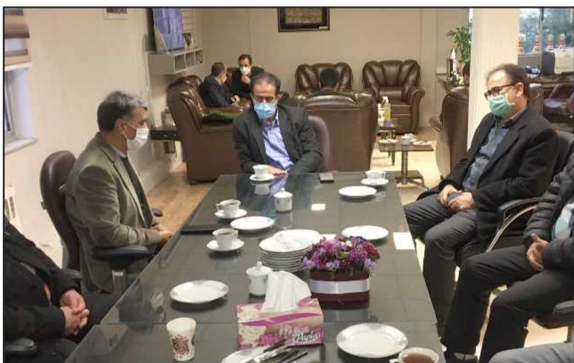
مدیر کل ورزش و جوانان گیلان در دیدار با پیشکسوتان فوتبال سپیدرود رشت: