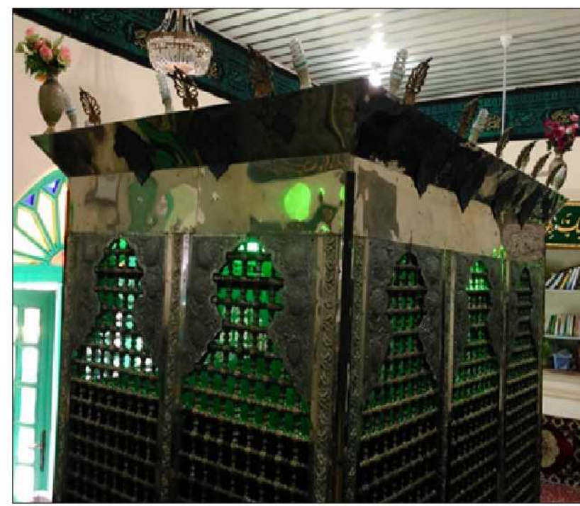
ضریح منصوب بر قبور مشاهیر سادات در گورستان قدیمی مدیریته رشت (ابتدای بلوار آیت الله ضیابری) بقعه السادات