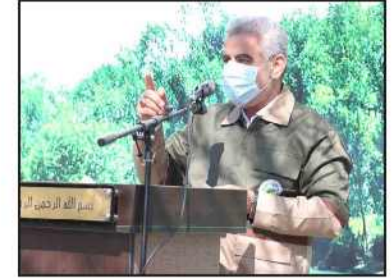
شهردار رشت تاکید کرد:

استاندار گیلان در مراسم روز درختکاری: توسعه فضای سبز نقش مهمی در نشاط افزایی عمومی دارد