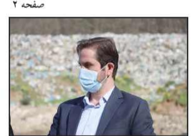
رئیس کل دادگستری گیلان:

اتخاذ تصمیمی منطقی برای پیشبرد پروژه های مدیریت پسماند لندفیل سراوان