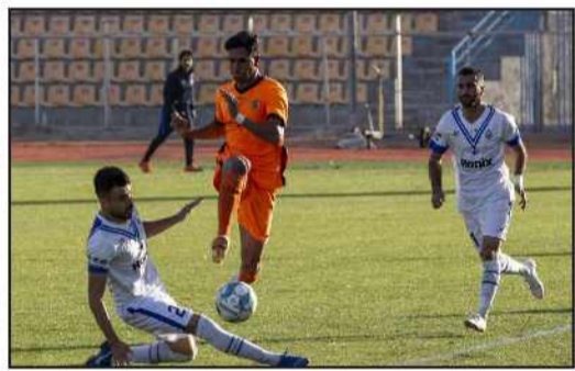
مورد توجه قرار گیرد.

سوال جواب: کمیته مسابقات سازمان لیگ زمان دیدار معوقه مس کرمان و ملوان بندرانزلی را اعلام کرد. به گزارش دی اسپورت: بر اساس کمیته مسابقات سازمان لیگ دیدار معوقه دو تیم از هفته بیست و ششم رقابت های لیگ دسته اول باشگاه های کشور روز دوشنبه ۵ اردیبهشت ماه ساعت ۲۰ ورزشگاه شهید باهنر کرمان برگزار خواهد شد. شایان ذکر است طبق برنامه قبلی اعلام شده قرار بود دیدار دو تیم از هفته بیست و ششم رقابت های لیگ دسته اول باشگاه های کشور روز سه شنبه ۳۰ فروردین ماه برگزار شود که به دلیل حضور مس در مرحله نیمه نهایی جام حذفی لغو و به زمان دیگری موکول شد.