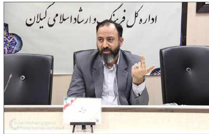
اداره کل فرهنگ و ارشاد اسلامی گیلان

مدیرکل فرهنگ و ارشاد اسلامی گیلان در مورد طرح سالم‌سازی دریا هم اشاراتی داشت و گفت: امسال نیز قصد داریم در حوزه طرح سالم‌سازی دریا بدرخشم زیرا در ارتباط با بودجه این کار حرکت بسیار خوبی انجام شده و کمبته‌های مربوط به آن نیز شکل گرفته است.