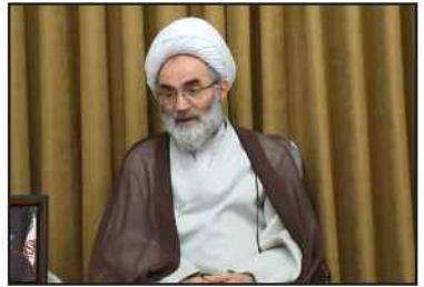
مدیرکل تامین اجتماعی گیلان:

نیروی جوان و کارآمد از ثروت های مهم کشور هستند