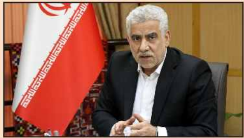
مدیرکل امور مالیاتی گیلان اعلام کرد: