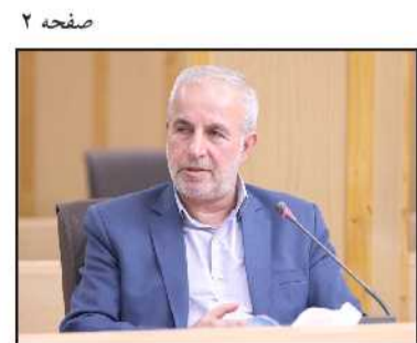
مدیرکل تعاون، کار و رفاه اجتماعی گیلان: