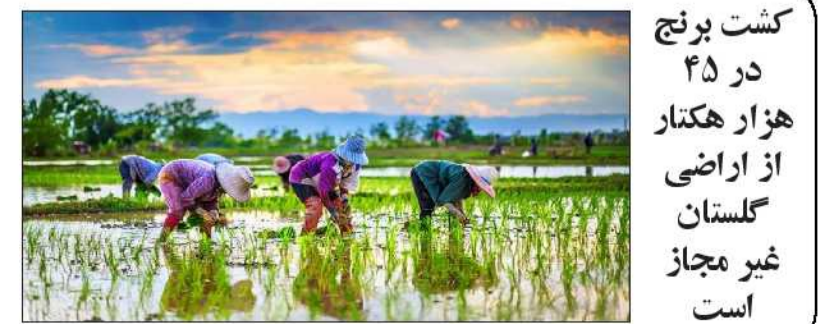
کشت برنج در ۴۵ هزار هکتار از اراضی گلستان غیر مجاز است