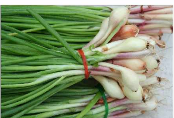
آنتی اکسیدانها و آنتی بیوتیک های شیمیایی کرد. کلیه ها و کبد بسیار موثر است. گیاه موسیر را مینوان جایگزین

ترکیبات سولفور در گیاهانی همچون موسیر، پیاز و سیر سبب خواص پزشکی و بوی تند در آنها شده است. موسیرها سرشار از پلی فنول، فلاونوئید و کوئرستین هستند که این مواد خاصیت ضد التهابی و درد دارند. مصرف روزانه موسیر، بافت های استخوانی را افزایش داده و در تسکین درد مفاصل و نقرس بسیار موثر است. برای استفاده حداکثری از سولفور موسیر بهتر است چند دقیقه قبل از پخت، این گیاه را خرد کرده و یا قبل از پخت، آب لیمو یا آبنارنج یا سرکه به آن اضافه کنید.