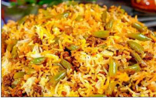
لوبیا پلو شیرازی موجب تقویت قلب و عروق، پیشگیری از انسدگی، کنترل فشار و چربی خون، کودکان در حال رشد و بهبود حافظه می شود.

ایرنا: لوبیا پلو یکی از غذاهای محلی استان شیراز است که حاوی کرپوهدرات، سدیم، پتاسیم، آهن، پروتئین، فیبر، روی، اسید فولیک، منیزیم، منگنز، قند، سلنیوم، کالین، ویتامین های A, B1, B2, B3, B6, B9, B12, C, E, K, D است. پروتئین بالا در این غذا موجب افزایش سطح انرژی، تقویت عمومی بدن و تقویت عضلات می شود. این غذا به علت داشتن کلسیم، منیزیم، فسفر و ویتامین D موجب تقویت استخوان ها و دندانها می شود و از بوکی استخوان جلوگیری می کند. فیبر موجود در این غذا موجب تقویت دستگاه گوارش و روده ها شده و از یبوست جلوگیری می کند. همچنین به علت داشتن اسید فولیک، آهن و B12 موجب افزایش گلبول های قرمز خون می شود و برای افراد کم خون، زنان باردار و جنین مفید است. این غذا به علت داشتن ویتامین های گروه B, A, E و سایر املاح معدنی موجب تقویت و جوانسازی پوست و موها می شود.