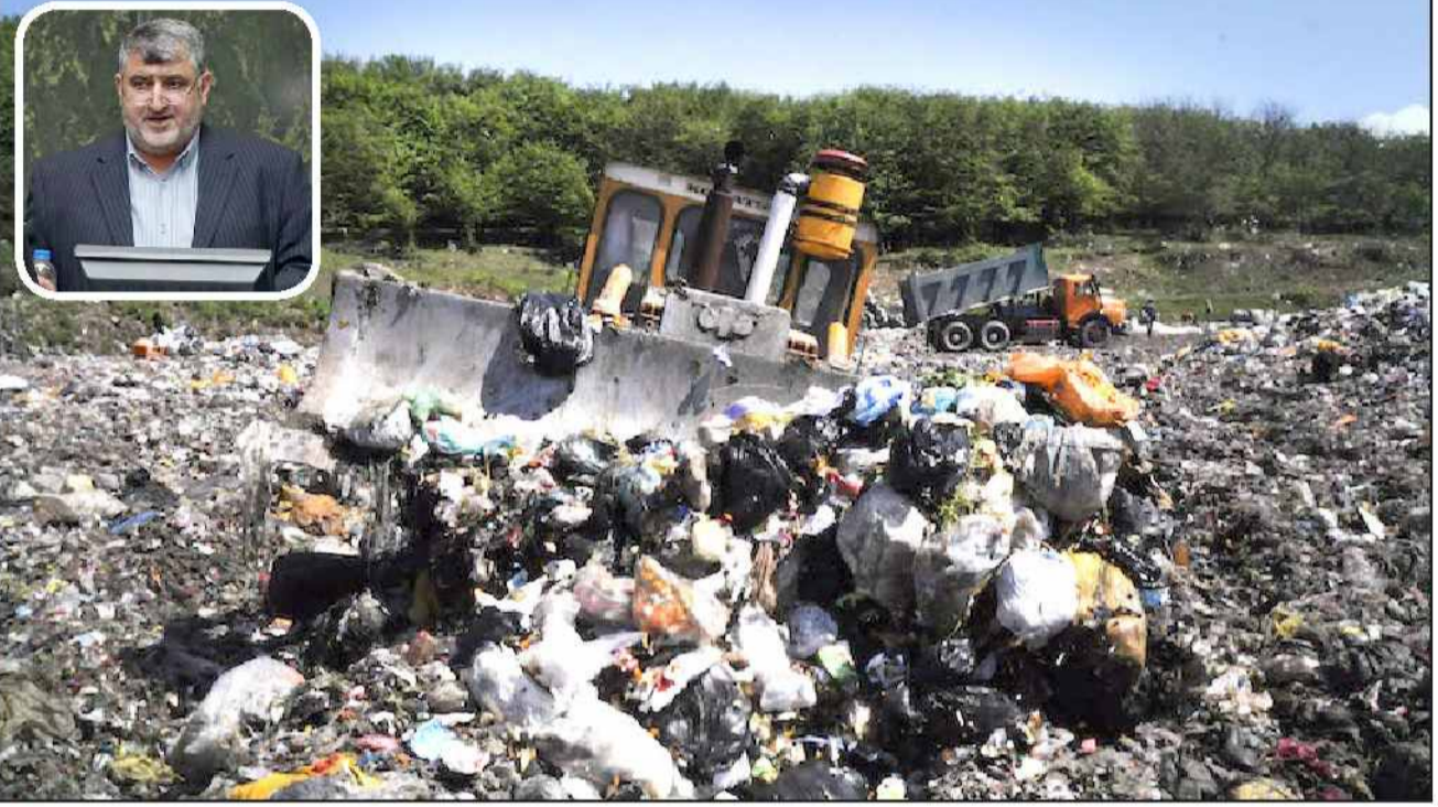
مدیرکل بنیاد مسکن کیلان خبر داد:

سر نوشت نامعلوم اعتبارات اختصاص داده شده به پسماند سراوان دلخوش مطرح کرد: