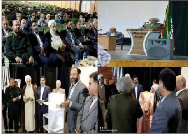
از آثار به یاد ماندنی دکتر شایسته به چاپ و انتشار رسیده ایشان در نظر دارد کتابی تحت شهرستان داشته و با توجه به اینکه ۹ تالیف

صفرپور همچنین اشاره کرد: سخنران نکوداشت دکتر فریدون شایسته مدیر کل فرهنگ و ارشاد اسلامی گیلان بوده که در خصوص عملکرد و شخصیت دکتر فریدون شایسته گفت: علم و ادب و فرهنگ، سیرایی ندارد، هر قدر دنبال علم برویم باز احساس عطش می کنیم.