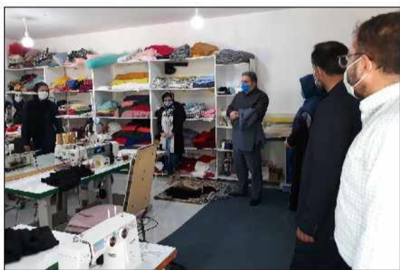
مدیرکل ستاد اجرایی فرمان حضرت امام (ره) گلستان از کمیته اشتغال استانداری گلستان برای اجرای حدود ۱۳۰ طرح اشتغالزای ستاد اجرایی استان از محل اعتبارات ۱۸ فائون بودجه مصوبه گرفته بود و اکنون در مرحله پرداخت تسهیلات به این طرح ها است.