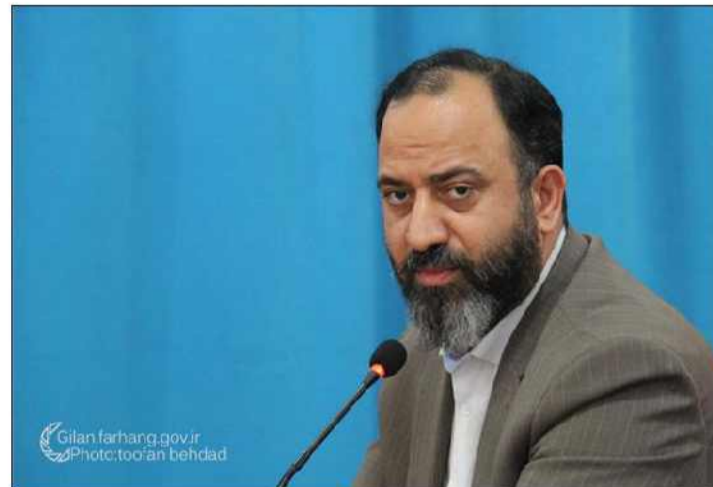
مدیرکل فرهنگ و ارشاد اسلامی گیلان با اشاره به تشکیل کارگروه های پژوهشی و مشورتی در شورای فرهنگ عمومی گیلان افزود: همه شهرستان ها دارای هسته های پژوهشی و مشورتی در شورای فرهنگی خود بوده و جلسات آن را برگزار کردند.

مدیرکل فرهنگ و ارشاد اسلامی گیلان عدم دسترسی مردم به پوشاک عقیفانه را مشکل دیگر در حوزه ترویج حجاب دانست و با اشاره به رویکرد سبلی مناسب در این خصوص اذعان کرد: باید پوشاک اسلامی به راحتی در دسترس مردم باشد.