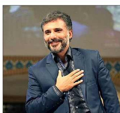
ایستنا: بازیگر و کارگردان سینما گفت: باید برنامه ریزی دقیق و عادلانه برای اکران ۳ سال اخیر سینما صورت گیرد. سید جواد هاشمی، بازیگر و کارگردان تئاتر، سینما

و تلویزیون گفت: بازار اکران فیلم های سینمایی در حال حاضر شلوغ است و فیلم های زیادی روی دست تهیه کننده ها مانده و همین شرایط اکران را سخت کرده است. او تأکید می کند باید برنامه ریزی دقیق، عادلانه و منطقی برای اکران آثار به جا مانده از سه سال اخیر صورت بگیرد. امیدواریم به ژانر کودک هم توجه ویژه ای شود زیرا حال سینمای کودک مثل همیشه خوب نیست.