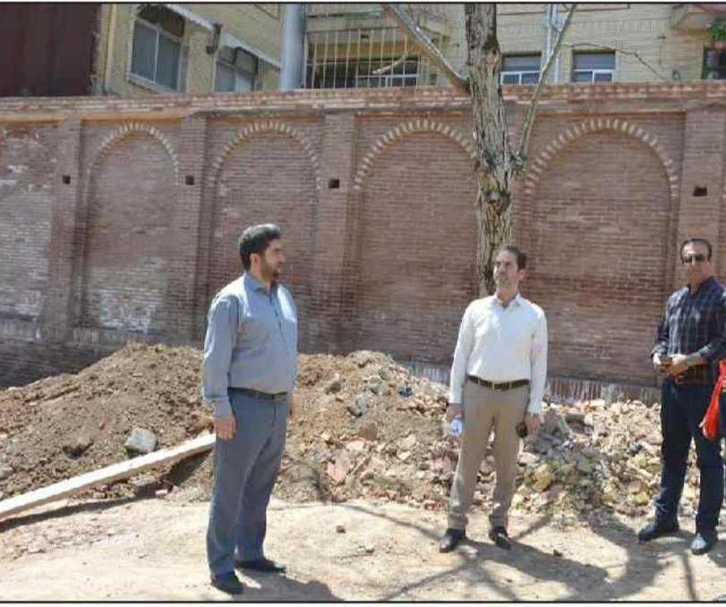
شهردار رشت خبر داد: