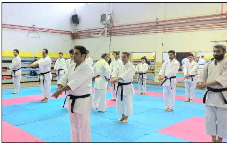
سوال جواب: کاراته کاهای هایاشی ها شیتوریو استان گیلان پس از حضور در استازهای مختلف کاراته و همچنین شرکت در استاز فنی کاراته استان گیلان با تدریس اساتید بزرگ کاراته

گفتنی است شرکت کنندگان در این آزمون در تمام دوره های آموزشی و فنی کاراته هایاشی ها شیتوریو استان گیلان حضور فعال داشتند.