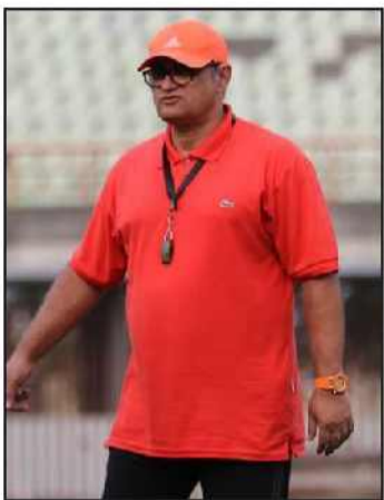
امید هرندی هیج اقدام موثری از سوی مدیریت باشگاه انجام نشده است زیرا حامی مالی این تیم اقدامات لازم را برای این امر انجام نداده و همه طرفداران ملوان و سایر طرفداران فوتبال در گیلان منتظرند که چه شرایطی برای این تیم زده خواهد شد.

از ادیهای عادی باید مراقبت کنی که زودتر خوب بشی و خیلی مسائل ریز و درشت دیگه خیلی سخت میشه مخفی کردنش برام. امشب اما تصمیم گرفتم این اتفاق رو با شما در میان بزارم و اینم بگم که این بیماری بهم یاد داد تا وقتی که خدا بخت فرصت نفس کشیدن میده باید از هر روزش استفاده کرد. به دوستام محبت کنم تو کارهام تلاش کنم. تا میتونم خاطرات خوب بسازم که یادگار بمونه و تا میتونم دل بدست بیارم. پشت مردم باشم از هیچی جز خدا ترسم. توکلم بخداست و سعی میکنم از روزهایی که خدا بهم داده درست استفاده کنم لکن هم ادا در نیایم که من به مبارزه با سر طران میرم و شکستش میدم اما به تقدیر الهی احترام میزارم هر چی خیره همون میشه. دمتون گرم."