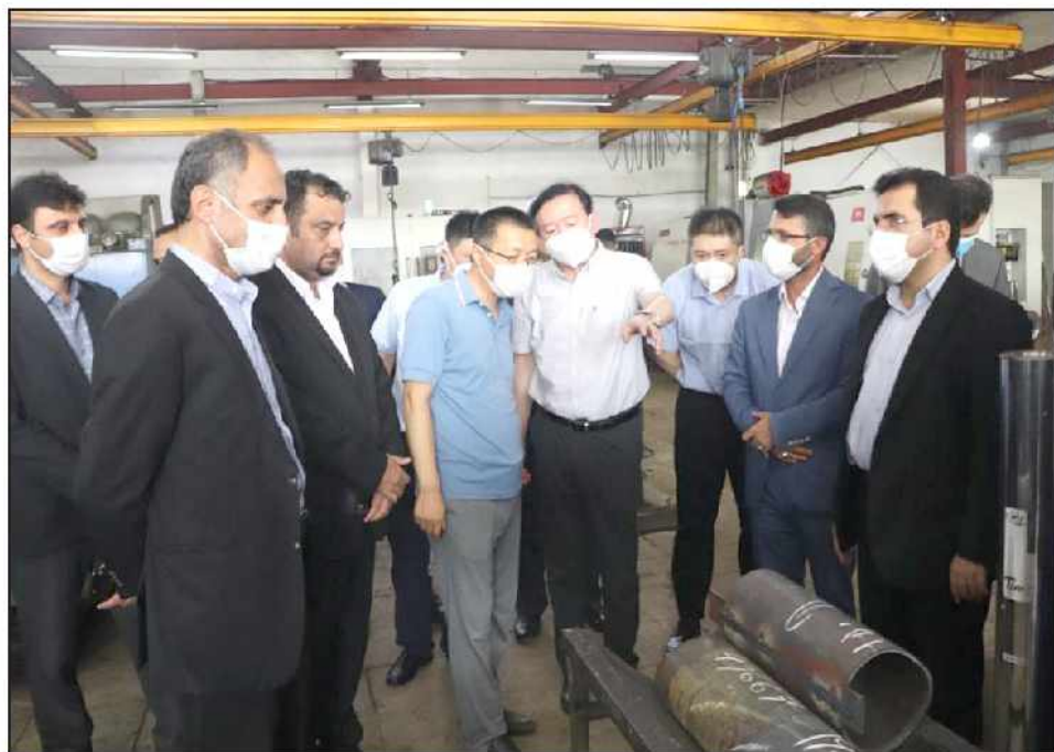
سفیر چین در ایران عنوان کرد:

افزایش رونق اقتصادی گیلان با اتصال منطقه آزاد انزلی به خط ریلی سراسری