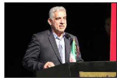
مدیرعامل شرکت توزیع نیروی برق گیلان خبر داد:

استاندار گیلان در همایش روز ملی تشکلهای باید از ظرفیت تشکلهای مردم نهاد در توسعه استان استفاده کنیم