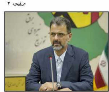
سرپرست شهرداری رشت مطرح کرد:

اجرای مرحله پنجم قطع برق ادارات پرمصرف استان