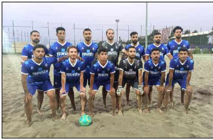
در هفته نخست از رقابتهای گروه اول صورت گرفت؛