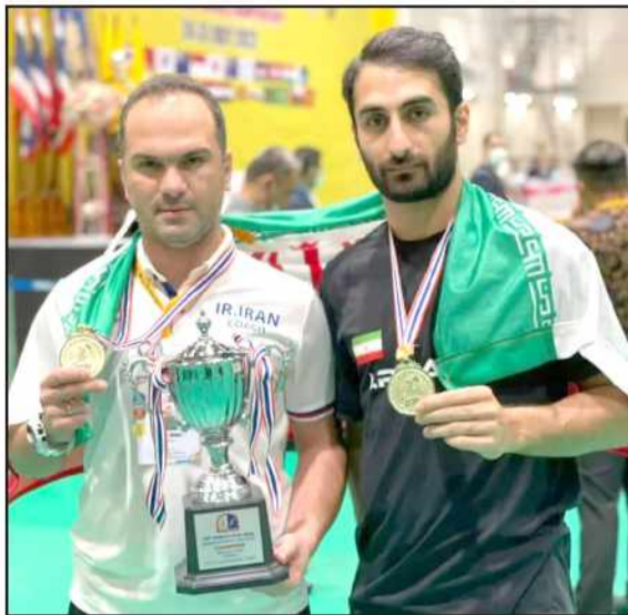
در هفته نخست از رقابتهای گروه اول صورت گرفت؛