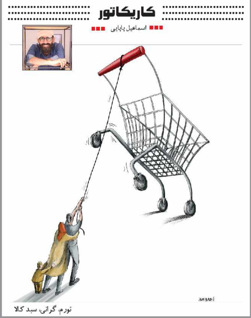
تورم، گرانی، سید کالا

فنی ضمن اشاره به اقدامات حوزه احیاء انجمن های فرهنگی و هنری استان گیلان با بیان اینکه پیشرفت در این حوزه نسبی بوده است ابراز داشت: انتظار داریم رؤسای ادارات فرهنگ و ارشاد اسلامی شهرستان ها در امور اجرایی از ظرفیت و مشارکت همه