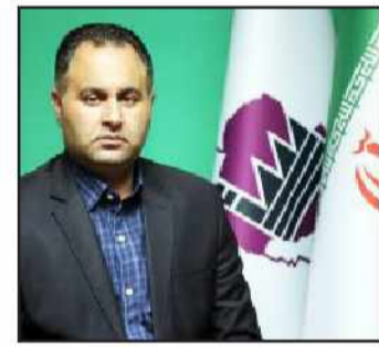
فرمانده انتظامی گیلان خبر داد: