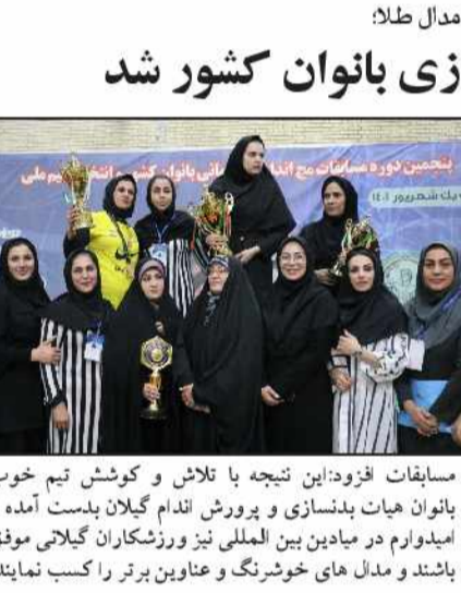
با کسب ۱۹ مدال طلا، گیلان قهرمان مسج اندازی بانوان کشور شد

سوال جواب: بانوان مسج انداز گیلانی در مسابقات قهرمانی کشور با کسب ۱۹ مدال طلا درخشیدند. ۴۱ بانوی مسج اندازی هیات بدنسازی و پرورش اندام گیلان در پنجمین دوره از رقابت های قهرمانی کشور انتخابی تیم ملی به میزبانی استان اردبیل شرکت کردند. در این مسابقات بانوان مسج انداز گیلانی در پنج رده ی وزنی و رده های سنی بزرگسالان، نوجوانان، جوانان و امید با کسب در مجموع ۱۹ طلا، ۱۰ نقره و هفت برنز حائز مقام اول در کشور شدند.