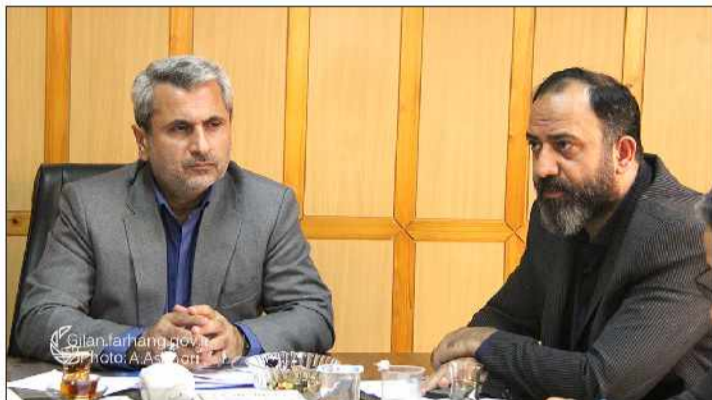
در ارتقای اعتماد اجتماعی نیز تأثیرگذار است. گفت: چهار برنامه محوری در سطح استان گیلان برای هفته دولت پیش بینی شده است.

مدیر کل فرهنگ و ارشاد اسلامی گیلان تشکیل فرآیند محتوا، راه اندازی کاروان‌های خبری و نشست خبری استاندار با اصحاب رسانه از جمله این چهار برنامه محوری هستند. افزود: باید از همه ظرفیت‌های فرهنگی و اجتماعی و رسانه‌ای برای ارائه عملکرد دولت استفاده شود. وی به نقش مهم انجمن جمع و روحانیت به ویژه تربیون نماز جمع که مردم اعتماد زیادی به آن دارند نیز اشاره و اضافه کرد: شورای سیاست‌گذاری انجمن جمع و تبلیغات اسلامی در کنار دولت و نظام حاکمیت باشند.