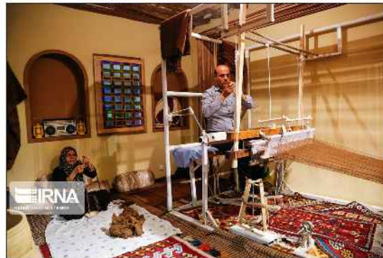
سیزدهم برای تشکیل این تعاونی‌ها یک هزار و ۱۳۰ میلیارد ریال اعتبار در نظر گرفته است.

وی از تشکیل و راه اندازی ۵۴ شرکت تعاونی توسعه روستایی در مازندران در راستای اجرای طرح فرزندی خیرداد و گفت که دولت