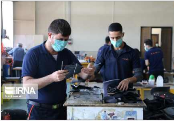
این پروژه ۳۱۰ میلیارد ریال در نظر گرفته شد.

آموزش های مهارتی اهتمام جدی و ویژه دارند. وی یادآور شد: البته در برخی از کشورها مانند ژاپن آموزش های نظری بیشتر توجه قرار گرفته و در برخی از کشورها همچون انگلستان مدارس مهارتی تاسیس کردند. وی تصریح کرد: در ایران آنچه امروزه شاهدش هستیم، در میان عامه جامعه میل به مدرک گرایی زیاد است که همین مساله باعث شده تا چهره ناخوشایندی از فارغ التحصیلان دانشگاهی بیکار به دلیل نداشتن مهارت در کشور داشته باشیم.