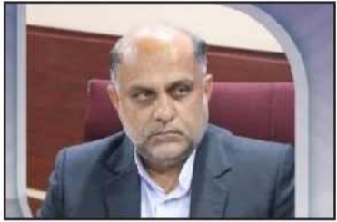
رئیس پلیس فتای استان کیلان: