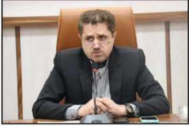
سرپرست اداره کل راهداری و حمل و نقل جاده‌ای کیلان خبر داد:

اعزام ۴۰ دستگاه اتوبوس به مرزهای مهران و خسروی برای بازگشت زوار اربعین