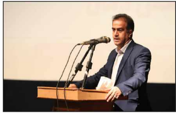
سوال جواب: مدیرکل ورزش و جوانان گیلان اظهار داشت: با کمک فدراسیون کشتی در توسعه امکانات و زیر ساخت های ورزش کشتی و استان گیلان توانایی درخشش