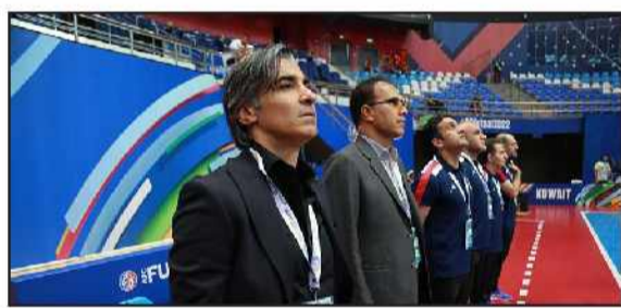
یک دروازه بان با یک بازی و ۵ دقیقه بهترین دروازه بان آسیا می شود. وی افزود: تا شب قبلش سعید مومنی کاندید بهترین دروازه بان آسیا بود. مناسفانه نشد ولی اینکه دروازه بان آن ها خوب کار کرد به روشن کرد. تا فینال هم بچه های ما خیلی درخشان عمل کردند. مناسفانه آخرین لحظه در فینال هم می توانستیم برنده باشیم. در کنفرانس خبری قبل از بازی به کاپیتان ژاپن گفتند به عربستان باخندید. گفت تیمی که خیلی خوب بازی کند حتما برنده نیست. ما خیلی خوب بازی کردیم ولی برنده نشدیم. مناسفانه موقعیت های خیلی زیادی را از دست دادیم.

کشورشان نقش آفرینی کنند. تازه امروز آمده ایم و باید ببینیم وضعیت چگونه است. اگر می خواهیم اقتدار و هویت فوتسال ما بالا بماند باید از همین امروز برنامه ریزی کرد. باید بازی های تدارکاتی مناسب داشته باشیم. باید بتوانیم تیم را خوب جمع و رهبری کنیم تا به هدف برسیم در غیر این صورت فردا دیر است. حالا هر کسی در هر جایی، من به مهدی تاج هم در رختکن گفتیم ما کارها را در اختیار فدراسیون است و می تواند تصمیم بگیرد.