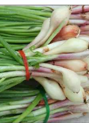
کلیه ها و کبد بسیار موثر است. گیاه موسیر را میتوان جایگزین

آنتی اکسیدانها و آنتی بیوتیک های شیمیایی کرد. گیاه موسیر را میتوان جایگزین