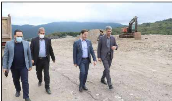
امورات بهسازی سروان سهل انگاری داشتند خبر داد و گفت: تأکید ما این است که از تشکیل جلسات بدون نتیجه خودداری شود.

برخورد با افرادی که در جریان تسریع در امورات بهسازی سروان سهل انگاری داشتند