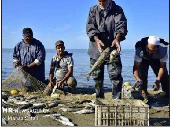
مهر: سرپرست اداره کل شیلات گیلان با اشاره به آغاز فصل صید ماهیان استخوانی در این استان از ۲۲ مهر ماه گفت: پیش بینی شده اسماک صیادان گیلانی ۲ هزار تن ماهی صید کنند.