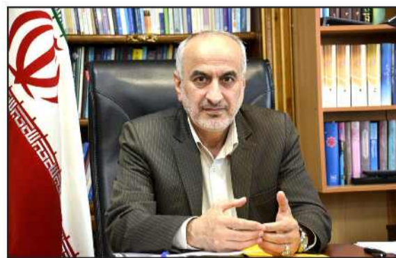
سوال جواب: مدیرکل صنعت کیلان گفت: سرمایه لازم جهت تکمیل طرح های مهم استان بیش از ۲۳۰۰ میلیارد تومان است.