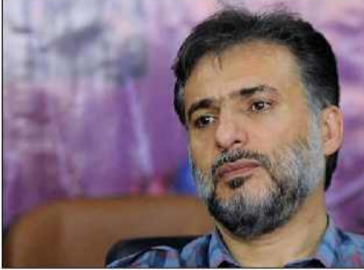
سید جواد هاشمی درباره تیم ملی و بازیکنان بیان کرد: باید بپذیریم که این تیم همه ایرانیان در همه دنیا است و باید پشت آنها باشیم.

اظهارات سید جواد هاشمی درباره حمایت از تیم ملی در جام جهانی در جامعه دو قطبی باید سکوت کرد. سید جواد هاشمی درباره تیم ملی و بازیکنان بیان کرد: باید بپذیریم که این تیم همه ایرانیان در همه دنیا است و باید پشت آنها باشیم. به گزارش ایسنا، این بازیگر سینما و تلویزیون درباره نبودنش در این دوره از جام جهانی برخلاف برخی از دوره‌ها عنوان کرد: روز قبل از سفر به قطر، انصراف دادم، قرار بود با چند نفر از دوستان و هنرمندان بروم اما نرفتم.