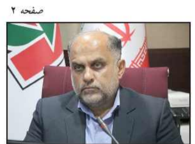
رئیس شورای شهر رشت:

آماده باش ۱۶۰ کیپ عملیات زمستانی در کیلان