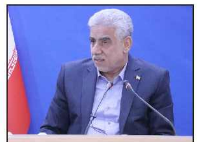
مدیرکل راهداری و حمل و نقل جاده‌ای کیلان خبر داد:

استاندار کیلان: تقویت سرمایه اجتماعی از مهمترین مأموریت های دولت است