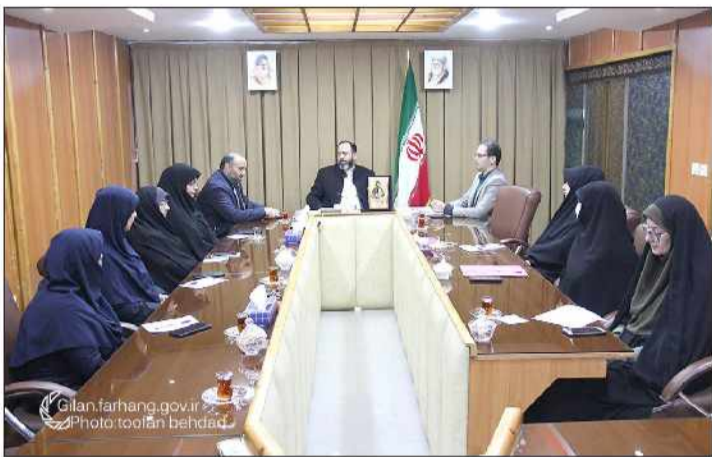
باناتون اداره کل فرهنگ و ارشاد اسلامی گیلان، این مهم را باتفه امید برای بانوان در راستای توجه پیش از پیش به آنان در جهت تعالی امور ذکر کرد. مدیرکل فرهنگ و ارشاد اسلامی گیلان

توجه به بانوان را موضوعی ذکر کرد که ریشه در گفتن انقلاب اسلامی، نگاه امام راحل عظیم الشان و رهبر معظم انقلاب دارد و تشکیک در این امر را نقشه دشمنان دانست. تقنی نشاط افزایی سازمانی با نقش آفرینی بانوان را از انتظارات خود از این شورای مشاورتی عنوان و ابراز امیدواری کرد که با تدوین برنامه های کاربردی و خلاقانه و نیز ارائه مشورت های لازم، شاهد تحرک بیشتر بانوان باشیم. وی با اشاره به اهمیت بزرگداشت هفته زن، خواستار تشکیل ستادی به همین منظور در اداره کل شد و این انتظار را مطرح کرد که امسال مناسبت هفته زن، روز مادر و ولادت حضرت زهرا (س)، متفاوت تر از سال های قبل و با مشارکت بیشتر بانوان برگزار شود. در پایان این دیدار: احکام اعضای شورای مشاورتی بانوان اداره کل فرهنگ و ارشاد اسلامی گیلان به آنان اعطا شد.