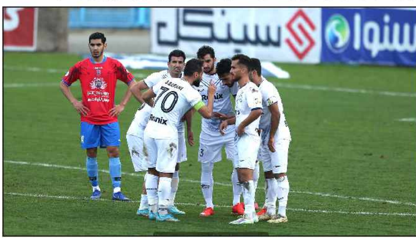
فداکار، مهاجم ملوان:

برگزار شد و طبق تصمیمات اتخاذ شده، این روند ادامه خواهد داشت که به طور حتم حضور تماشاگران در بازی های خانگی ملوان به نفع این تیم خواهد بود. وی گفت: تیمهای پرتقداری همچون ملوان هنگام بازی های خانگی می توانند از این امتیاز نیز سود ببرند که نمونه بارز آن دیدار ملوان مقابل نساجی بود که تماشاگران با حمایت همه جانبه خود، باعث شدند تا ملوانان با دوندگی و تعصب بیشتر بر بازی تسلط یابند و سرانجام نیز پیروز شوند. وی ادامه داد: به طور حتم حضور طرفداران پرشور و پرشمار ملوان به این تیم کمک خواهد کرد و این امیدواری وجود دارد که ملوانان در بازی های خانگی خود با حضور طرفدارانش نتایج بهتری را کسب کنند. وی اضافه کرد: به هر حال این انتظار می رود که ملوان در لیگ جاری در میانه جدول قرار گیرد و برای سال آینده برنامه ریزی مناسبی داشته و با جذب چند بازیکن تاثیرگذار، به فکر حضور بین ۶ تیم برتر باشد که البته باید مشاهده کرد که برای سال آینده تفکرات مدیریتی این باشگاه چه خواهد بود. هرندی در خاتمه بیان کرد: به هر حال با توجه به شرایط موجود باید است که دوباره ملوان به تیم های انتهایی جدول نزدیک شود و انتظار است که روند پیشرفت ملوان همچنان طی شود و این تیم در ادامه رقابت های لیگ برتر نتایج بهتری را کسب کند.