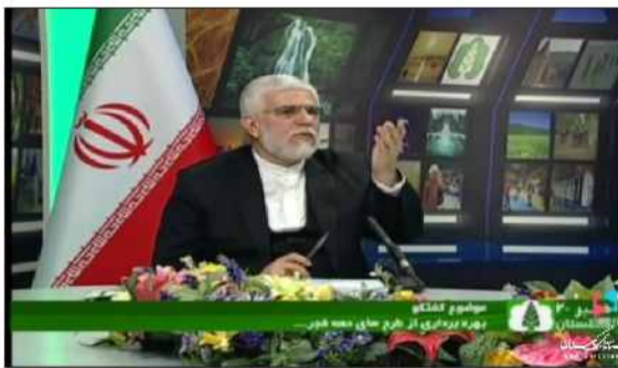
استاندار گلستان در گفتگوی ویژه خبری سیمای مرکز استان خبر داد.

ورزشی در گرگان از مهمترین طرح های حوزه ورزش و جوانان است که دیروز ده میلیارد تومان برای ساخت آن اختصاص دادیم و قرار است ۷۵ میلیارد تومان از اعتبارات وزارت ورزش و ۷۵ میلیارد تومان دیگر نیز از سازمان برنامه بودجه به این طرح اختصاص یابد.