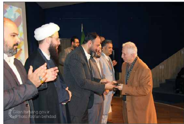
رضا قنقی با اشاره به استقبال خوب مردم از فیلم های جشنواره چهل و یکم ادامه داد: اختتامیه جشنواره با رویکرد قدردانی از بازیگران و عوامل گیلانی تولید فیلم های جشنواره، مدیران سینماهای میزبان و سازمان ها و نهادهای همکار برگزاری اکران همزمان فیلم ها برگزار شد. وی خاطر نشان کرد: با پایان یافتن چهل و یکمین جشنواره بین المللی فیلم فجر و اکران همزمان فیلم ها، برگ زرینی در فعالیت های

سوال جواب: آیین اختتامیه و تجلیل از فعالان اکران همزمان چهل و یکمین جشنواره بین المللی فیلم فجر در گیلان با حضور استادان و پیشکسوتان هنر نمایش، شماری از بازیگران و عوامل گیلانی تولید فیلم های جشنواره و مدیران سینماهای میزبان در تالار مرکزی رشت برگزار شد. به گزارش روابط عمومی اداره کل فرهنگ و ارشاد اسلامی گیلان: آیین اختتامیه و تجلیل از فعالان برگزاری اکران همزمان چهل و یکمین جشنواره بین المللی فیلم فجر در گیلان با حضور استادان و پیشکسوتان هنر نمایش، شماری از بازیگران و عوامل گیلانی تولید فیلم های جشنواره و مدیران سینماهای میزبان غروب روز چهارشنبه ۲۶ بهمن ماه ۱۴۰۱ در تالار مرکزی رشت برگزار شد. مدیرکل فرهنگ و ارشاد اسلامی گیلان در این آیین اظهار داشت: از تاریخ ۱۷ تا ۲۴ بهمن ماه، پذیرای مردم علاقمند به هنر متمدن در سه سالن سینمایی تالار مرکزی رشت و سینماهای ۲۲ بهمن و سپیدرود بودیم.