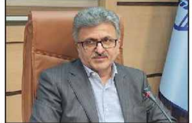
رئیس شورای شهر رشت مطرح کرد:

لزوم همکاری بیشتر مجموعه شورا و شهرداری رشت در راستای توسعه خدمات سلامت محور صفحه ۲