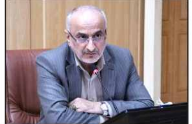
سرپرست دانشگاه علوم پزشکی گیلان تاکید کرد:

لزوم همکاری بیشتر مجموعه شورا و شهرداری رشت در راستای توسعه خدمات سلامت محور صفحه ۲