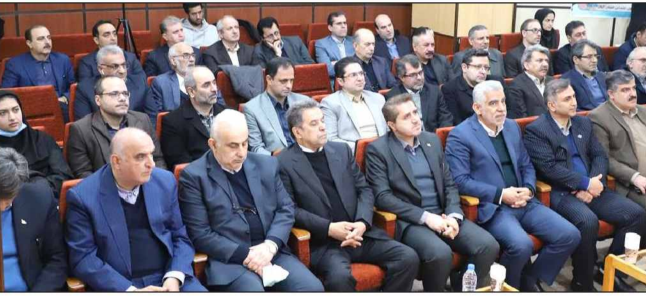
مدیرکل تامین اجتماعی گیلان:

استاندار گیلان تاکید کرد: سازمان تامین اجتماعی با عرصه های تولید، صنعت و اشتغال گره خورده است