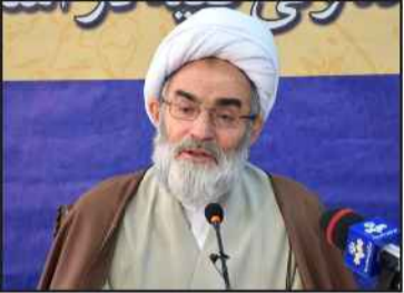
نائب رئیس شورا خبر داد:

برگزاری جلسه انتخاب شهردار جدید رشت در روز چهارشنبه