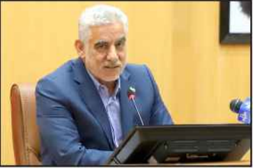
نماینده ولی فقیه در کیلان:

برخی المان ها در شهرها سازگار با فرهنگ استان نیست