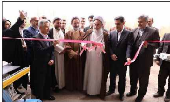
مهر: نماینده ولی فقیه در گیلان گفت: همه دستگاه‌ها در استان با همکاری نیروی مسلح، دستگاه قضا و استانداری در کنار یکدیگر تلاش کنند تا مسیر برای اشتغال آفرینی جوانان هموار شود.

آیت‌الله رسول فلاحتی ظهر چهارشنبه در مراسم بهره‌برداری از ۱۲ هزار و ۵۰۰ طرح اشتغالزایی کمیته امداد گیلان با اشاره به تأثیرگذاری طرح‌ها همچون نظارت بر زندگی جوانان اظهار کرد: ایجاد اشتغال و تولید توسط هر شکل و نهادی موجب برطرف شدن بسیاری از مشکلات اجتماعی می‌شود.