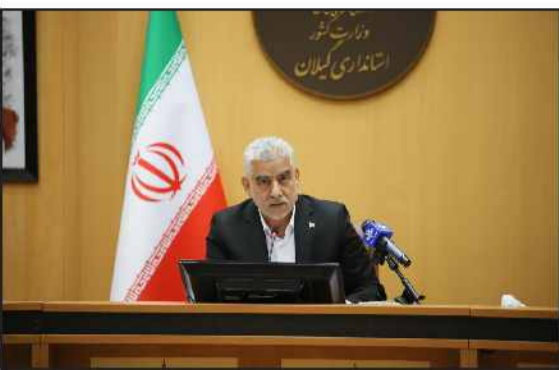
مبارک رمضان و ماههای محرم و صفر مشکلی به وجود نیاورد.