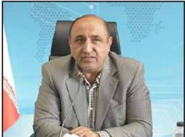
مدیرکل صنعت کیلان خبر داد:

توزیع ۲۷۴ تن گوشت منجمد در فروشگاههای زنجیره ای استان