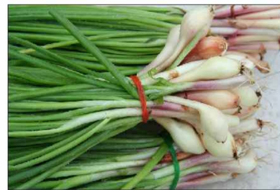
آنتی‌اکسیدانها و آنتی‌بیوتیک‌های شیمیایی کرد. کلبه‌ها و کبک بسیار موثر است. گیاه موسیر را میتوان جایگزین

ترکیبات سولفور در گیاهانی همچون موسیر، پیاز و سیر سبب خواص پزشکی و بوی تند در آنها شده است. موسیرها سرشار از پلی فنول، فلاونوئید و کوئرستین هستند که این مواد خاصیت ضد التهابی و درد دارند. مصرف روزانه موسیر، باعث کاهش التهاب و تسکین درد مفاصل و نقرس بسیار موثر است. برای استفاده حداکثری از سولفور موسیر بهتر است چند دقیقه قبل از پخت، این گیاه را خرد کرده و یا قبل از پخت، آب لیمو یا آب‌نارنج یا سرکه به آن