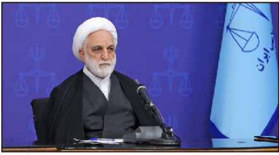
رئیس قوه قضاییه:

ایستاد: رئیس قوه قضاییه با بیان اینکه مسئله اولویت‌دار کشور «معیشت مردم» است، گفت: مسئولان بخش‌های مختلف قضایی در راستای تحقق شعار سال، هر آنچه می‌توانند و به بخش‌های اجرایی کمک کنند. رئیس قوه قضاییه در این راستا با نهایت جهد و اهتمام، انجام دهند. رئیس دستگاه قضا با تصریح بر اینکه اولویت داشتن موضوع معیشت مردم، به معنای غفلت از سایر موضوعات نیست، تصریح کرد: عمل به قانون در همه زمینه‌ها و امور، هم یک وظیفه است و هم امری نافع است؛ فرد قانون‌گریز و هنجارشکن باید بداند که هم به دیگران ضرر می‌رساند و هم خودش منضر می‌شود.