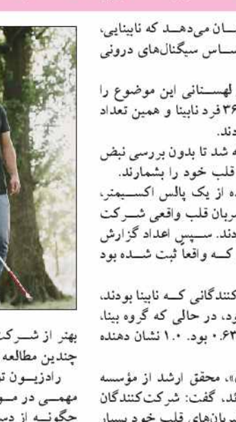
بهرتر از شرکت کنندگان بینا در مطالعه ما و در چندین مطالعه قبلی عمل کردند.

مطالعات جدید نشان می دهد که نابینایی توانایی فرد را در احساس سیگنال های درونی بدن افزایش می دهد. محققان سوئدی و لهستانی این موضوع را در مطالعه ای روی ۳۶ فرد نابینا و همین تعداد افراد بینا آزمایش کردند. از هر کدام خواسته شد تا بدون بررسی نبض یا لمس بدن، ضربان قلب خود را بشمارند. محققان با استفاده از یک پالس اکسیمتر، به طور همزمان ضربان قلب واقعی شرکت کنندگان را ثبت کردند. سپس اعداد گزارش شده را با اعدادی که واقعاً ثبت شده بود مقایسه کردند. در میان شرکت کنندگانی که نابینا بودند، میانگین دقت ۰.۷۸ بود، در حالی که گروه بینا، میانگین دقت نشان ۰.۶۳ بود. ۱۰۰ نشان دهنده نمره کامل بود. «دومینیکا رادزیون»، محقق ارشد از مؤسسه کارولینسکا در سوئد، گفت: شرکت کنندگان نابینا در شمارش ضربان های قلب خود بسیار