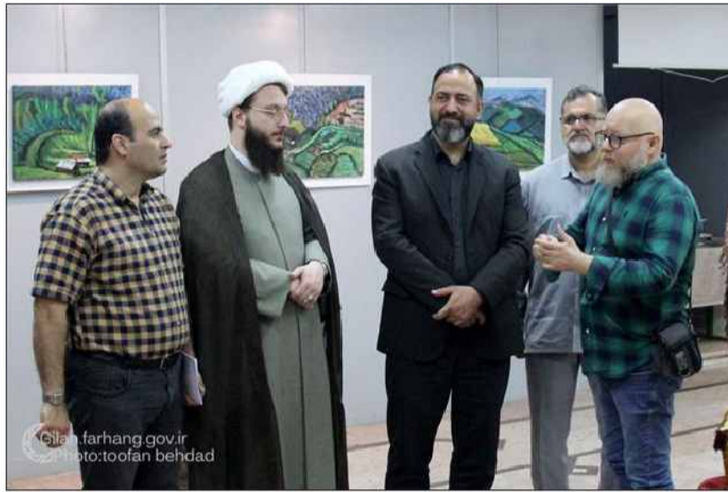
توجه حکمرانان فرهنگ و هنر هستند و لازمست در کنار اجرای برنامه های فرهنگی و هنری برای بزرگسالان، به این گروه سنی هم توجه شود. جشنواره استانی "تئاتر کودک" در راستای اهمیت تئاتر کودک و تاثیر آن در تعلیم و تربیت