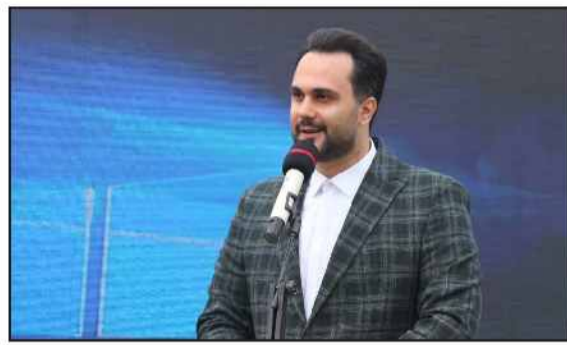
ورزش‌های دریایی و ساحلی و هیئت آن در استان افزود: فدراسیون

رئیس هیئت ورزش‌های دریایی و ساحلی گیلان با اشاره به جامعه هدف این ورزش، بیان کرد: ورزش‌های دریایی و ساحلی گیلان جمعیت بیش از ۶۰ هزار نفری را در بر می‌گیرد.