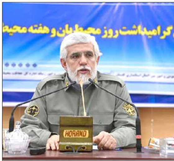
گزارشگر: روز محیط بان و هفته محیط بان

ایرنا: استاندار گلستان با اشاره به اهمیت خلیج گرگان در اقتصاد و محیط زیست منطقه گفت: دولت سیزدهم اعتبارات قابل توجهی برای احیای این پهنه آبی از خشکی در نظر گرفته و بر همین اساس این گستره آبی را با چنگ و دندان هم که شده از نابودی نجات می دهیم.