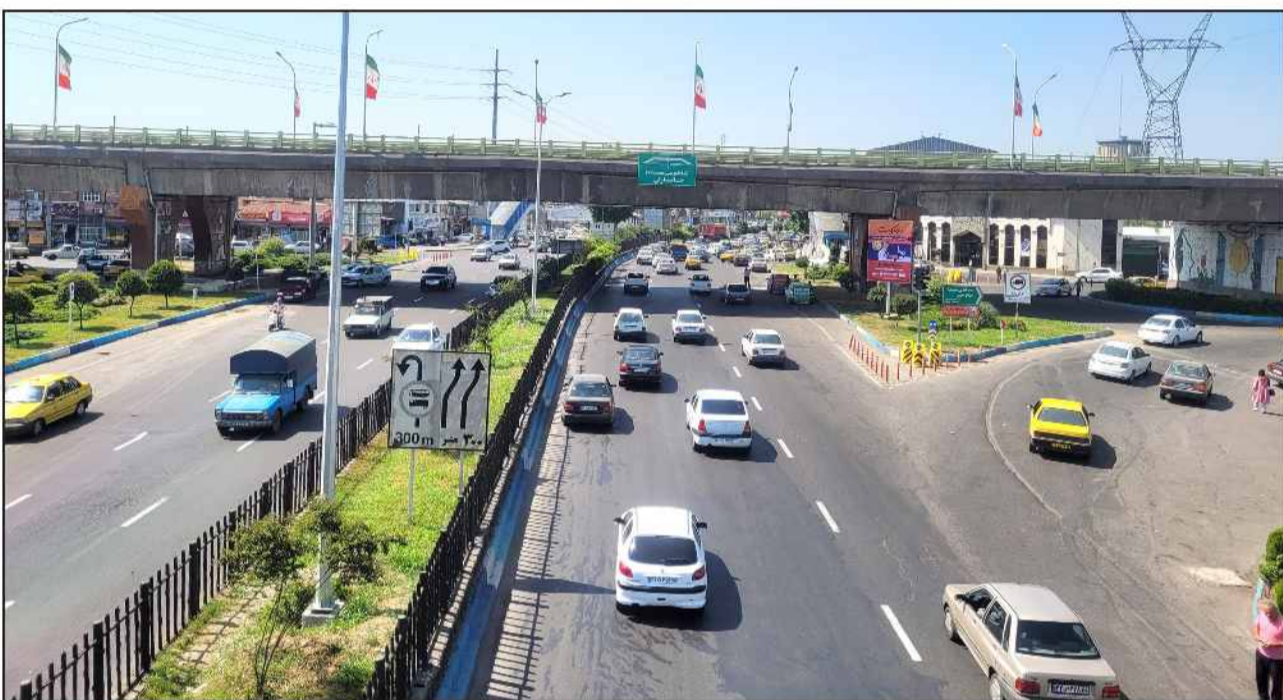
فرآیند اجرایی چهار تقاطع غیر همسطح در رشت