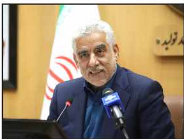
رئیس سازمان صمت گیلان:

استاندار گیلان در مراسم تجلیل از صادرکنندگان برتر: برای انبوه سرمایه گذاران در گیلان باید فرش قرمز پهن کرد