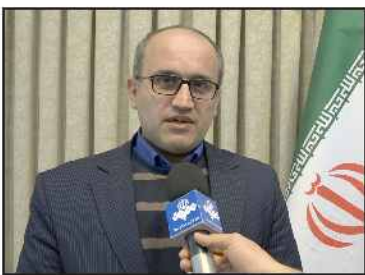
رئیس سازمان مدیریت و برنامه ریزی مازندران:

مازندران رتبه ۸ تولید ناخالص ملی را دارا است