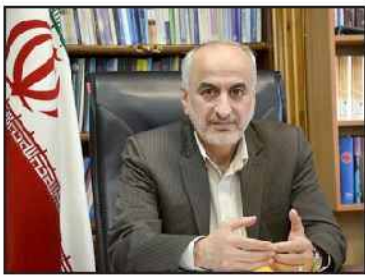
رئیس سازمان مدیریت و برنامه ریزی مازندران:

برای گسترش ارتباطات تجاری هیچ بن بستى در گیلان وجود ندارد