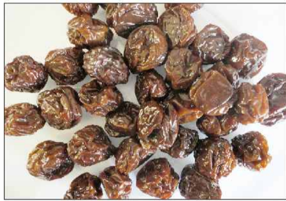
رنگ‌دانه در آلوها وجود دارد و با رادیکال‌های آزاد مخرب مقابله کرده و به این ترتیب جلوی این بلا را می‌گیرد. سلامت استخوان‌ها و یکی دیگر از مواردی که می‌تواند از فواید آلو خشک نام برد محکم کردن استخوان‌ها و جلوگیری از

پوکی استخوان آنهاست. مصرف روزانه ۳ عدد آلو خشک می‌تواند از پوکی استخوان جلوگیری کند و همچنین توجه داشته باشید که این میوه ویتامین‌های بسیار زیادی دارد که در استخوان‌سازی به شما کمک خواهند کرد. سلامت سیستم گوارش آلو خشک به کولول (بخشی از روده بزرگ) کمک می‌کند تا وظیفه خود را به خوبی انجام دهد باید بدانید که هر یک عدد آلو خشک حاوی یک گرم فیبر است. مصرف این میوه میزان قند خون را تنظیم کرده و خطر ابتلا به دیابت نوع ۲ را کاهش می‌دهد. فشار خون سالمی نگه دارد.