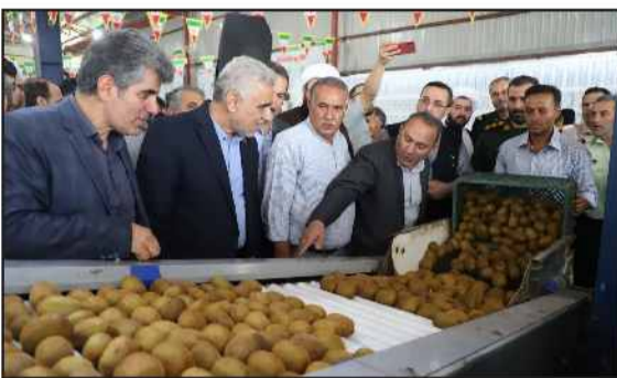
پروژه با بیش از ۴۰ هزار میلیارد ریال در دست بهره برداری است.

نماینده عالی دولت در استان گیلان با اشاره به پروژه خط ریلی رشت به کاسپین ورشت به استناد اظهار امیدواری کرد تا راهاندازی این خط ریلی هر چه سریعتر بدون بروز مشکلاتی برای مردم به بهره برداری برسد.