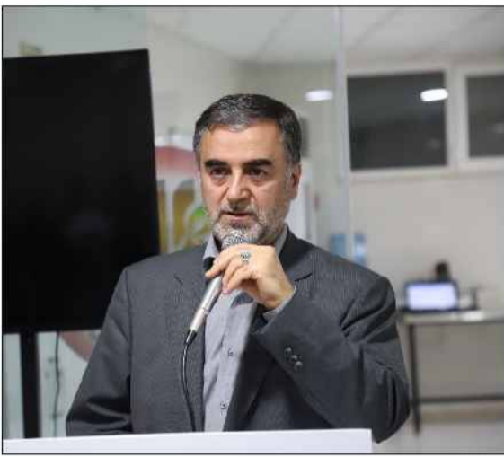
استاندار مازندران در جریان نشست خبری با خبرنگاران.

درصد افزایش یابد. این مقام مسوول با اشاره به اینکه حمایت های لازم را جهت گسترش شعبه های این واحد تولیدی در مناطق روستایی افزایش می دهد، بیان داشت: این واحدها در مناطق محروم که سرشار از گیاهان دارویی می باشد، ایجاد انگیزه خواهد کرد و رونق اقتصادی روستا به ارمغان می آورد.