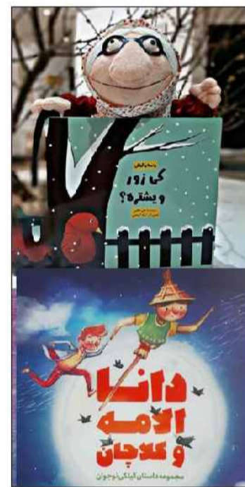
چکناجی کردم که در حوزه ادبیات و داستان و شعر فولکلور گیلان زیاننده است و

این بازیگر و نویسنده، با اشاره به فعالیت خود در انجمن سینمای جوان استان گیلان، ادامه داد: بیش از ۲۰ سال برای رادیو و تلویزیون برنامه و جنگ و فیلم داستانی و سریال و مستند ساخته ام که رویکرد آن فرهنگ گیلان و فولکلور بود؛ هم‌زمان با فعالیت‌های حوزه رادیو و تلویزیون، آغاز به نوشتن برای مجله «گیله» و «محمدتقی